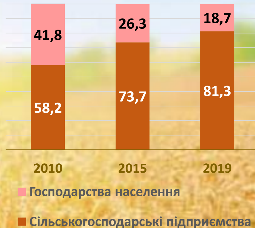
Частка категорій господарств у виробництві продукції сільського господарства, %