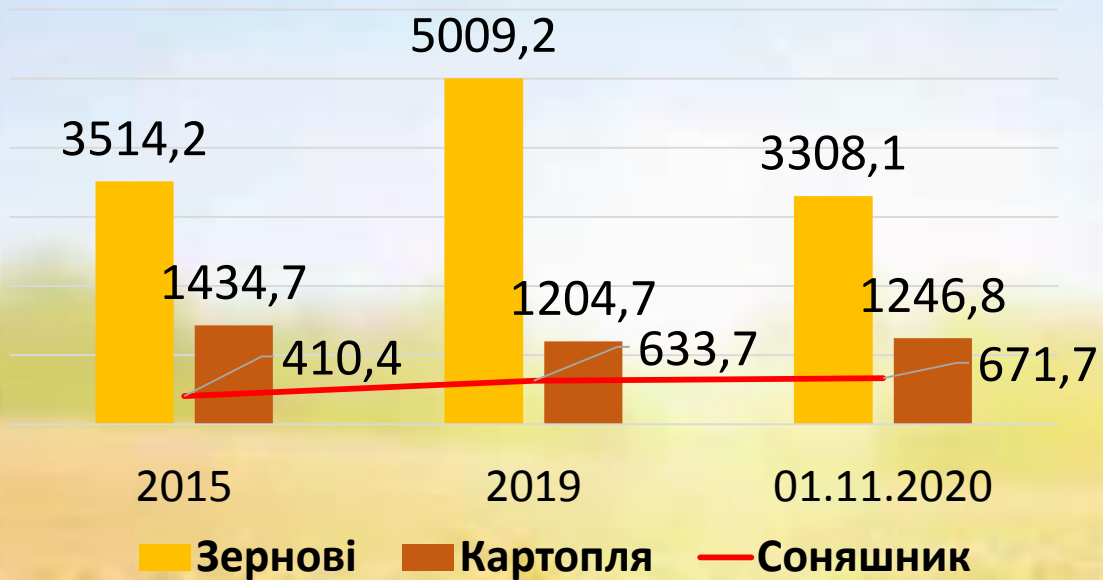
Виробництво сільськогосподарських культур, тис. т