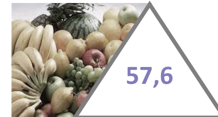
плоди, ягоди, виноград