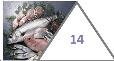
риба і рибні продукти