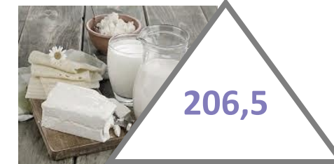
молоко та молочні продукти