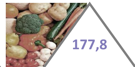
овочі та баштанні