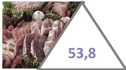
м'ясо та м'ясні продукти